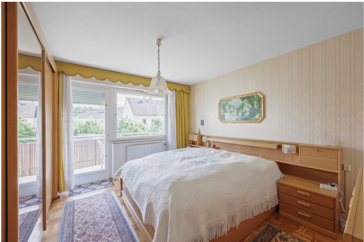
8 - Schlafzimmer OG