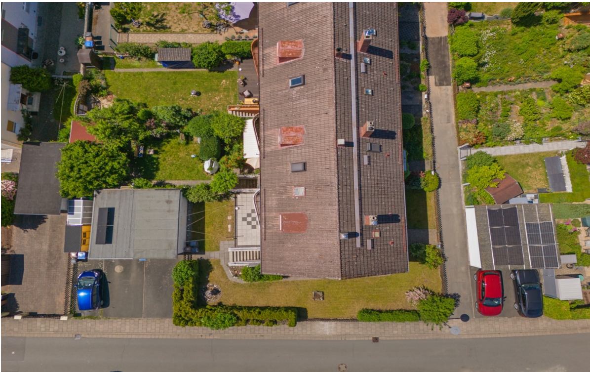
16 - Draufsicht