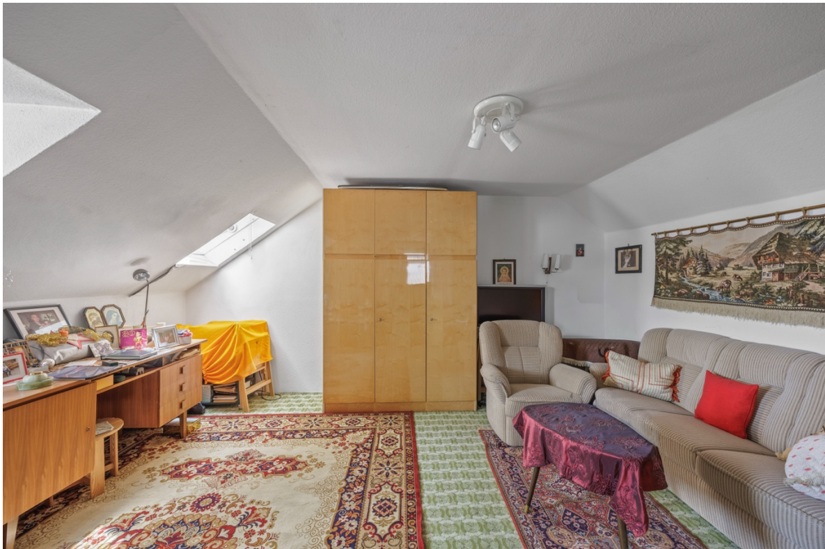
14 - Studio DG

Ihr Ansprechpartner Helena Stümpfle Telefon – 0170 4692158