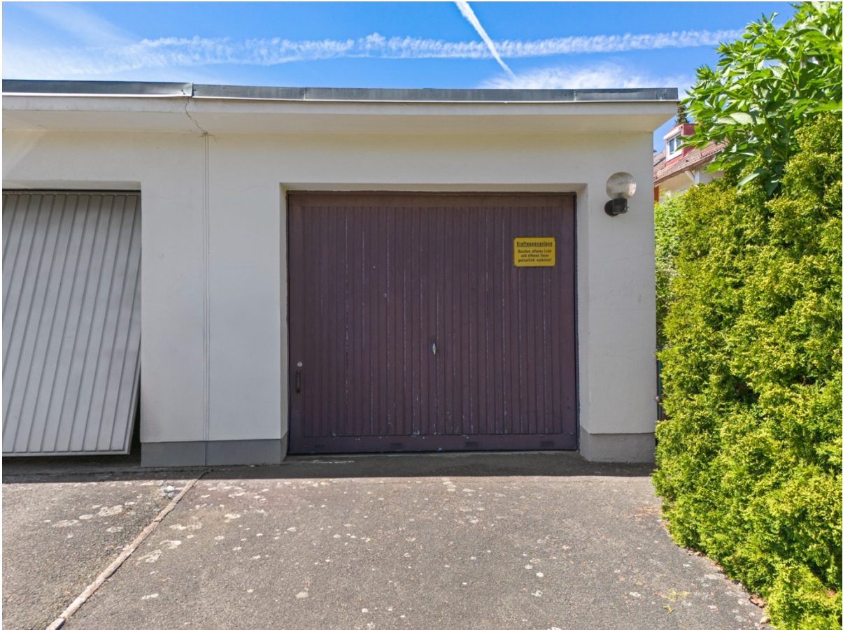
17 - Garage