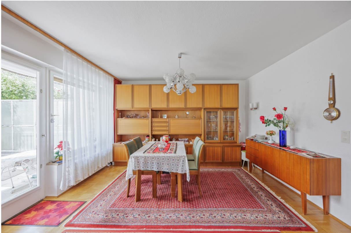
5 - Esszimmer