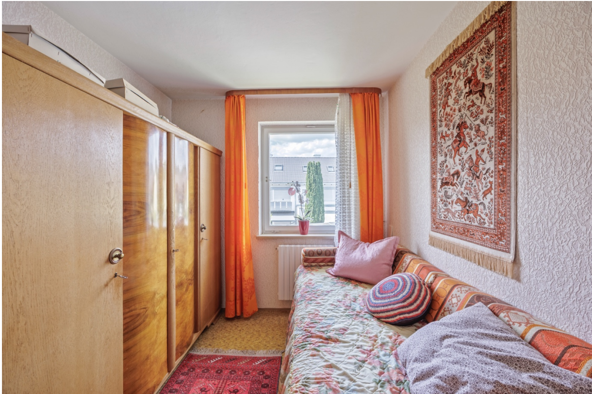
11 - Kinderzimmer OG