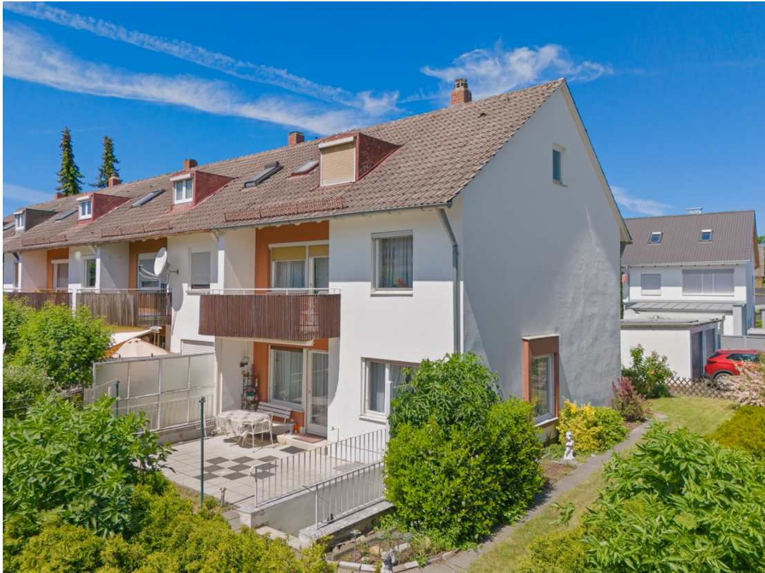
1 - Außenansicht