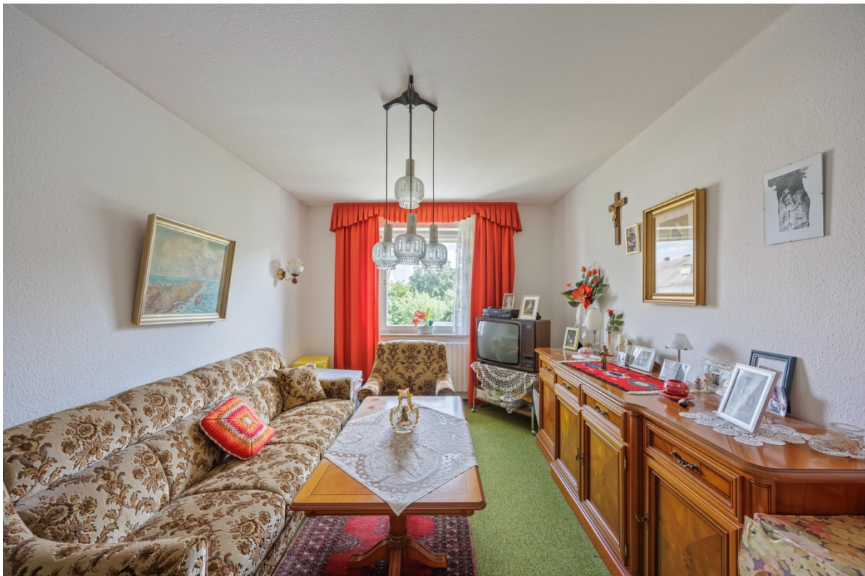
10 - Kinderzimmer OG