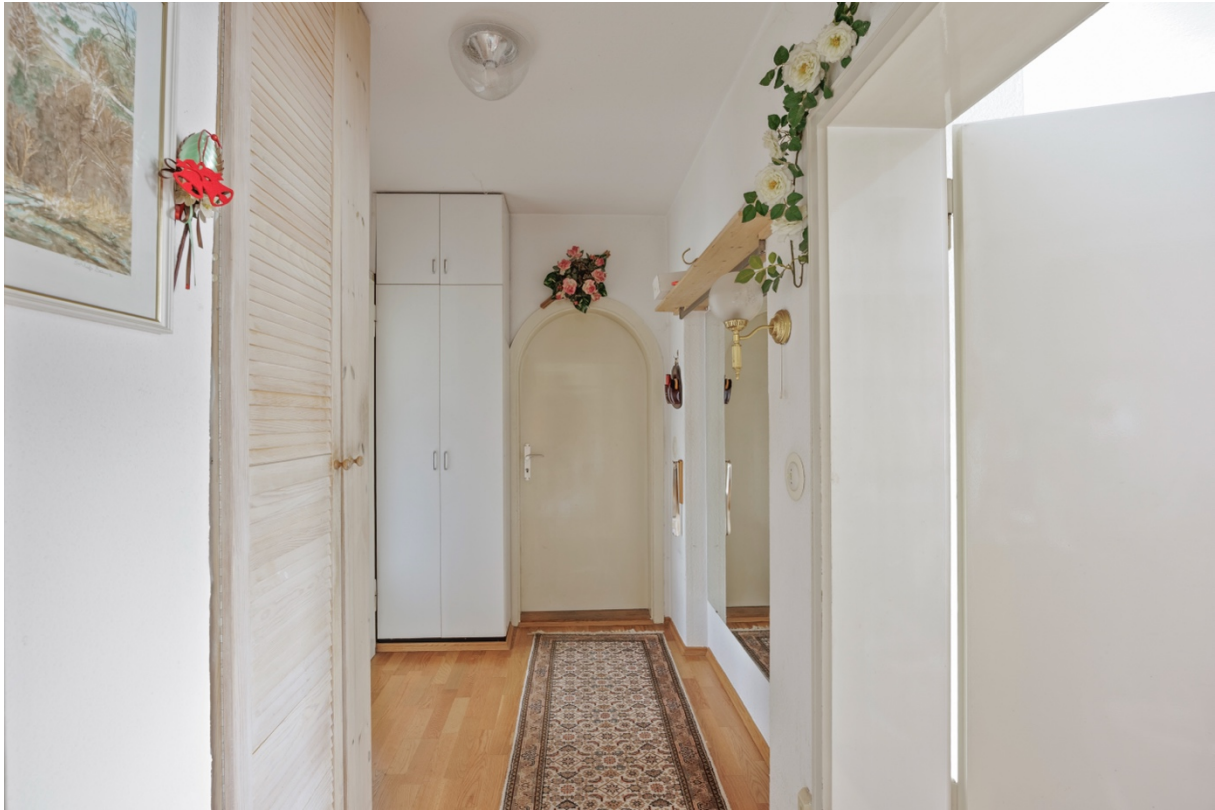
7 - Flur