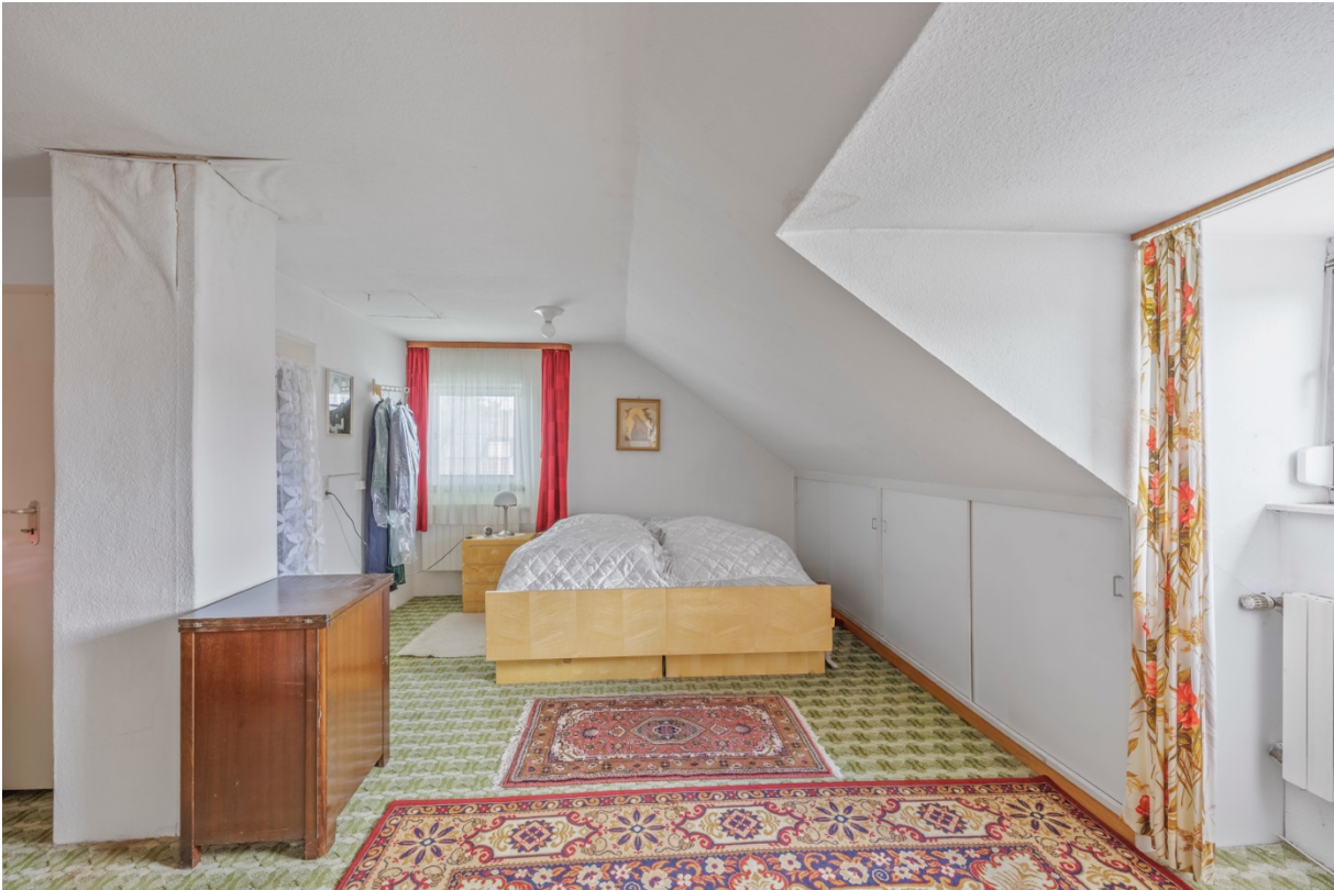
13 - Studio DG