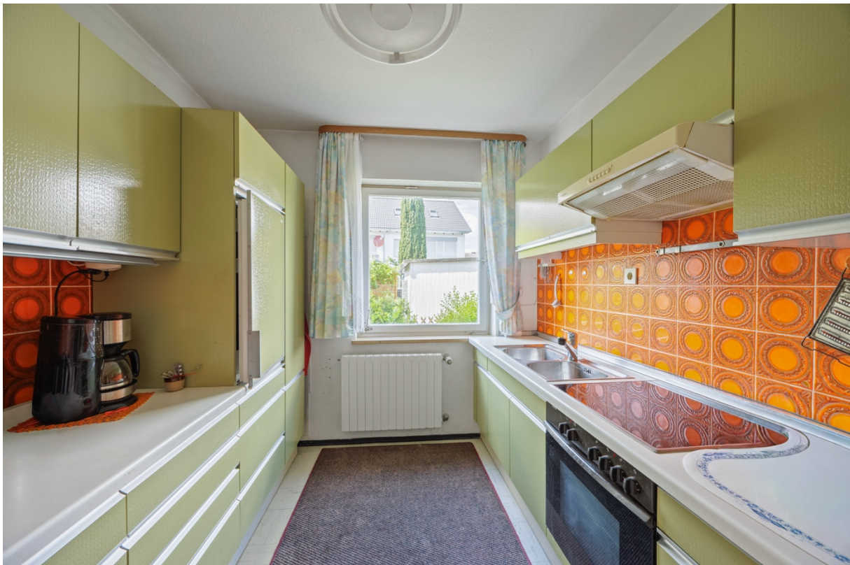
6 - Küche