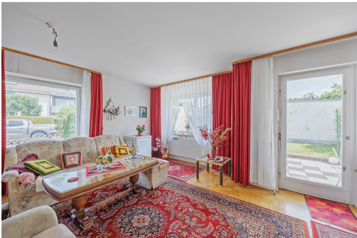
4 - Wohnzimmer