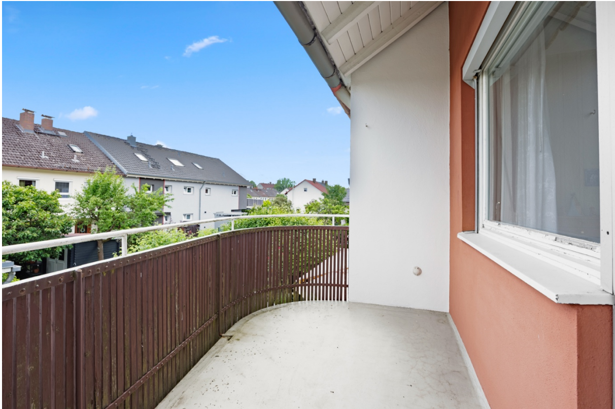
9 - Aussicht Balkon