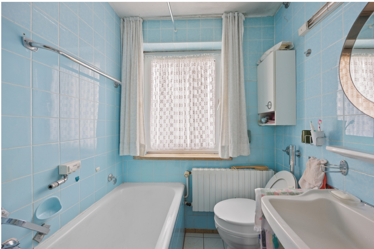
12 - Badezimmer OG