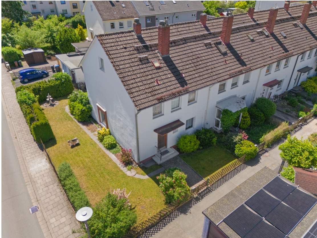
3 - Außenansicht