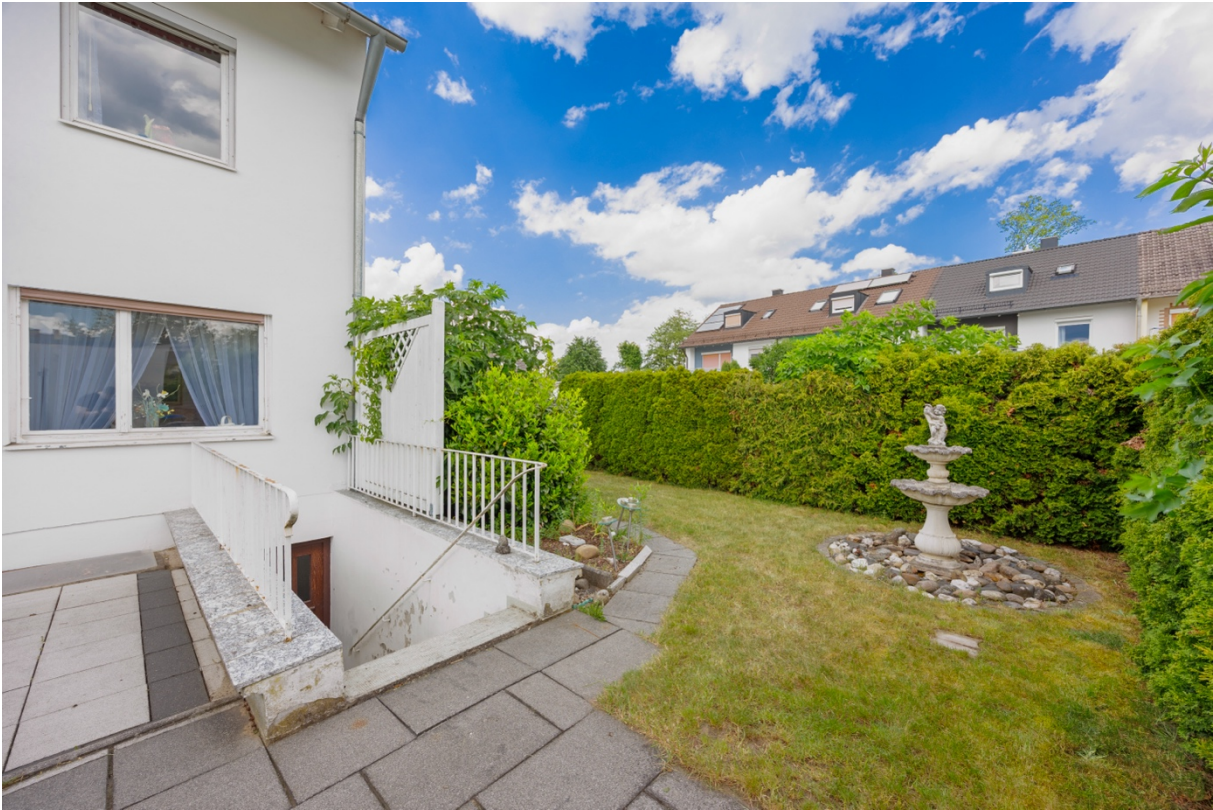
15 - Gartenansicht