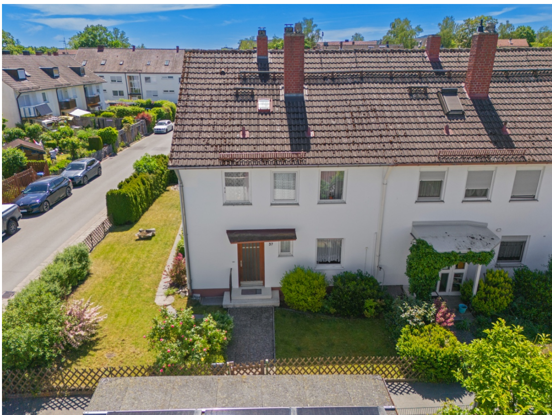
2 - Außenansicht